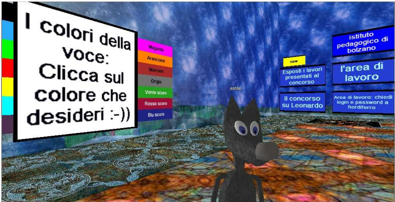
Una bambina "grande"