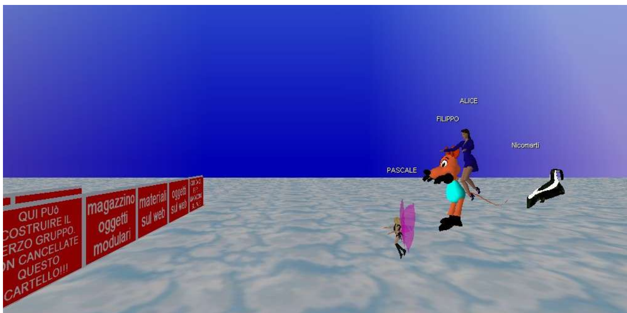
Tutti consultano i cartelli