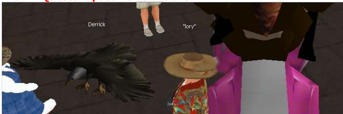
Ora è un rapace...