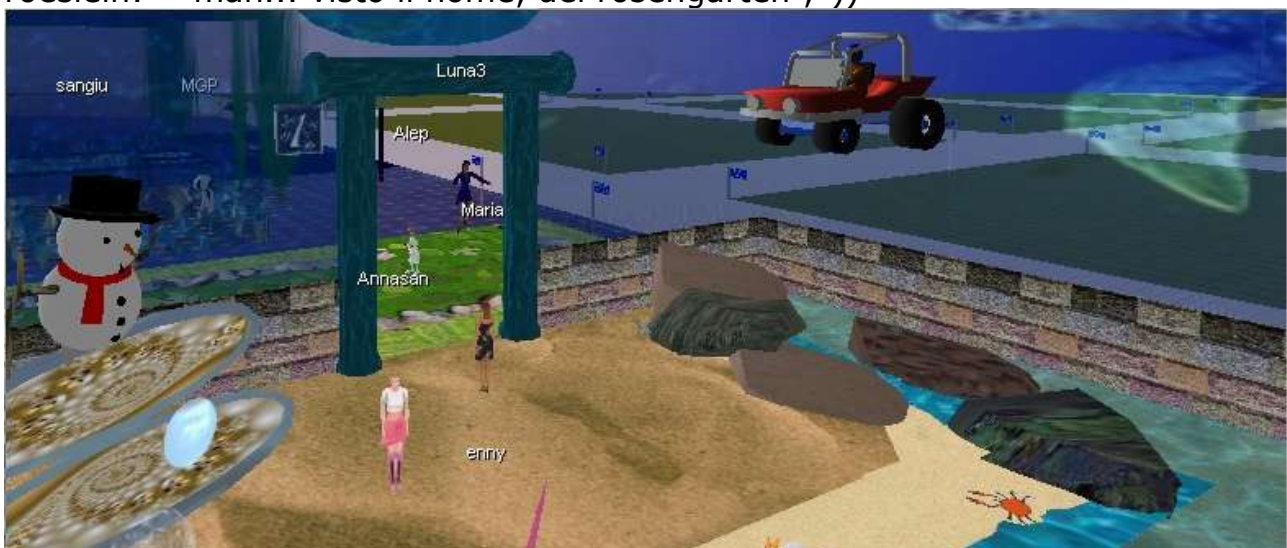
Aula1, documentazione dei progetti