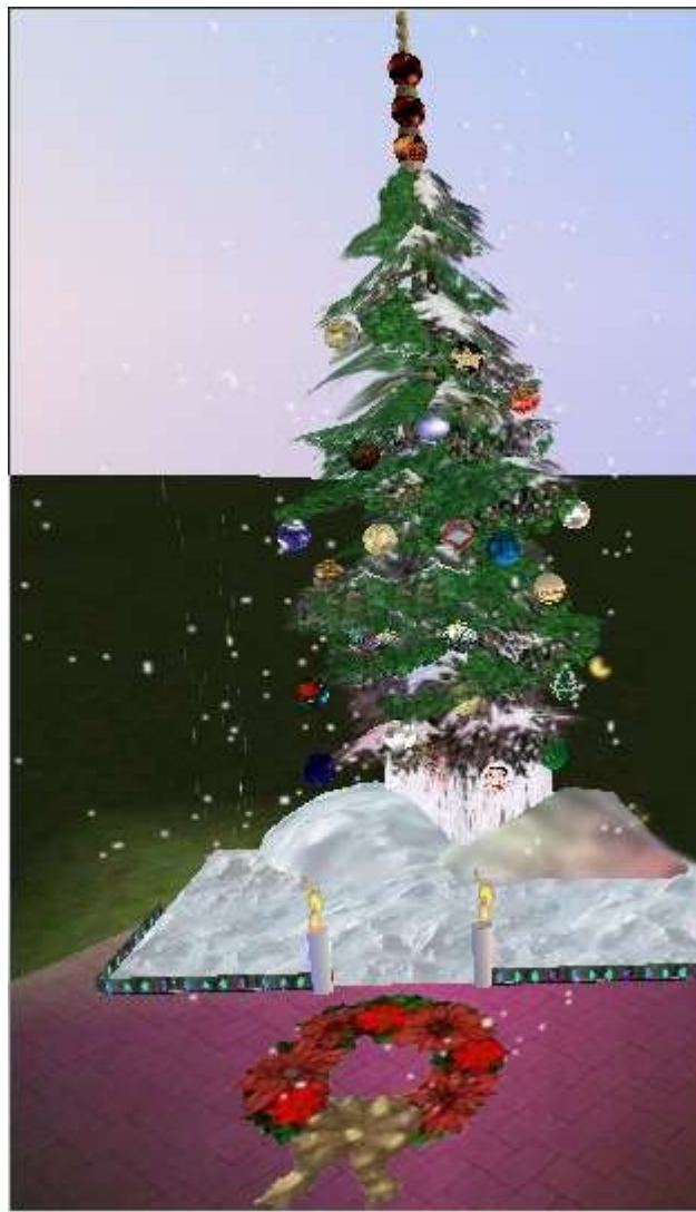
L'albero di Natale preparato da Luna3 in piazza

Annasan: dai che bello l'albero con la neve!